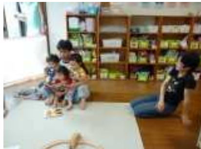
平成27年7月 ○保護者様の日保育士体験○