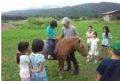
平成27年8月20日 ○小学生キャンプ2日目○