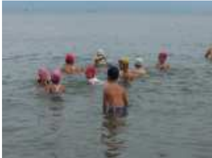
平成27年8月19日 ○小学生キャンプ1日目○

また、高槻市公益活動サポートセンターのNPOフェスタに今年も出展、高槻市内のNPOの中でも少しずつ知名度が上がって色々な協働が出来つつあります☆