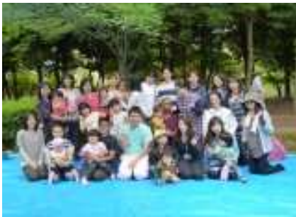
平成27年5月23日 ○ふれあいピクニック○

なお、各月の利用状況は4月11名、5月10名、6月10名、7月12名、8月15名、9月17名、10月18名となっており、年度始めは苦しい状況でしたが、今は安定をしております。今年度は従業員の待遇改善や備品購入などに多くの予算を投じましたが、何とか年度末には黒字化に持っていかれるかと感じております。今後とも、子どもたちの為にご支援お願いいたします。