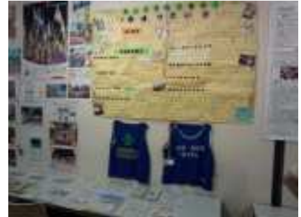
平成27年9月12日 ○NPOフェスタ展示参加○