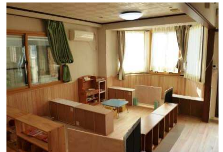
平成27年9月 ○2階保育室改装工事○